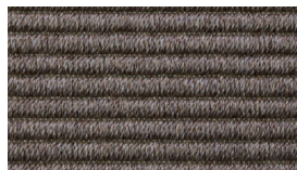
20 TERRA UMBER