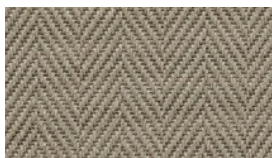
TWEED 15 SACCO SACKCLOTH