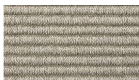
10 SABBIA SAND

Webtechnik: Wilton Verarbeitung: bouclé h.6 mm Material: 100% recyceltes PET Neuseelandwolle, Rückseite aus anallergischem und antibakteriellem Naturkautschuk. Gewicht: 2,6 kg/m 2 ±3% Farben: Sand, Sackbeige oder Erdbraun.