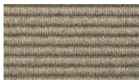
15 SACCO SACKCLOTH