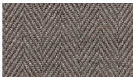
TWEED 20 TERRA UMBER